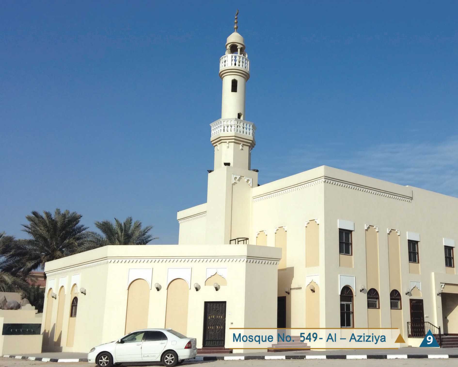
Mosque No. 549- Al – Aziziya