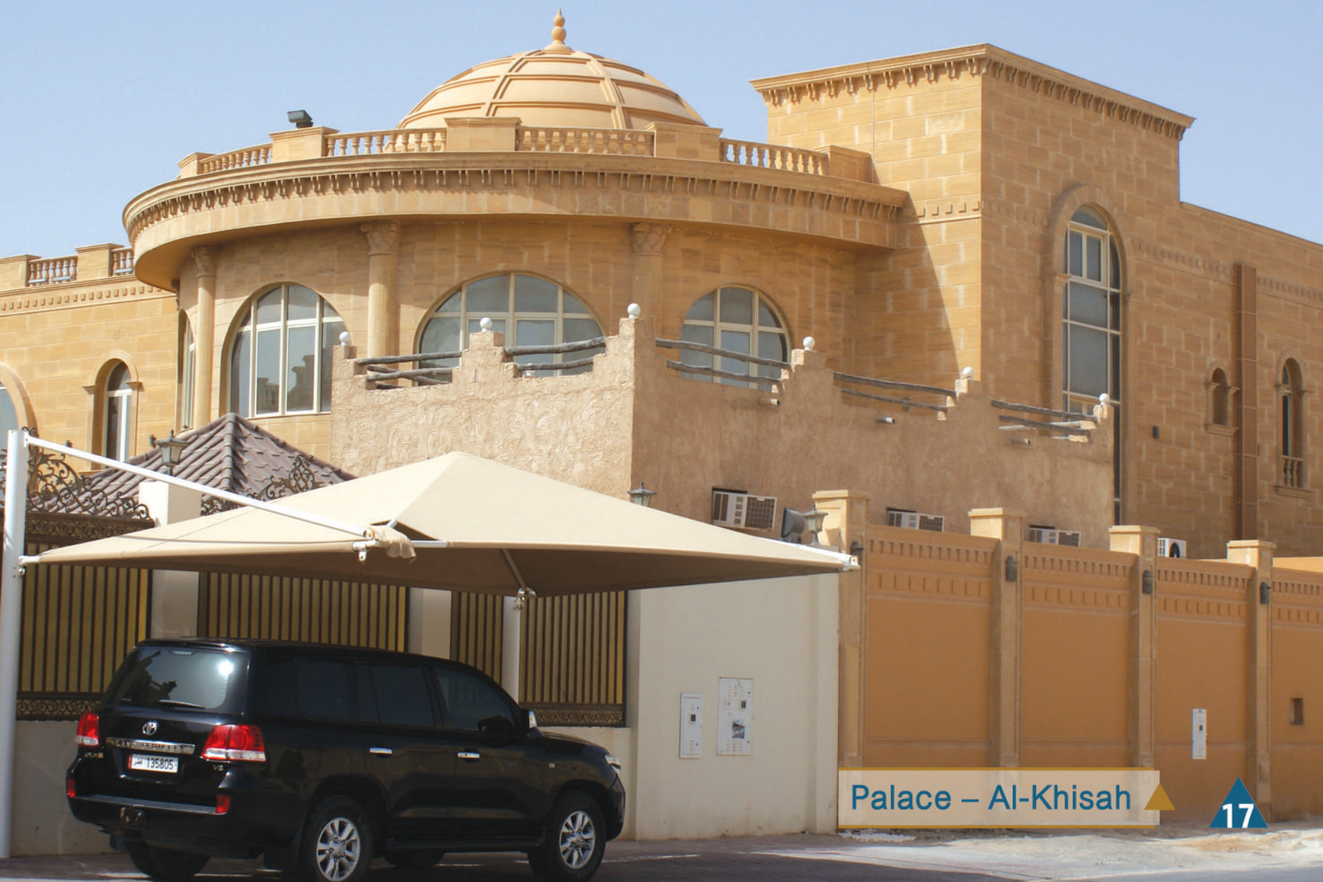
Palace – Al-Khisah