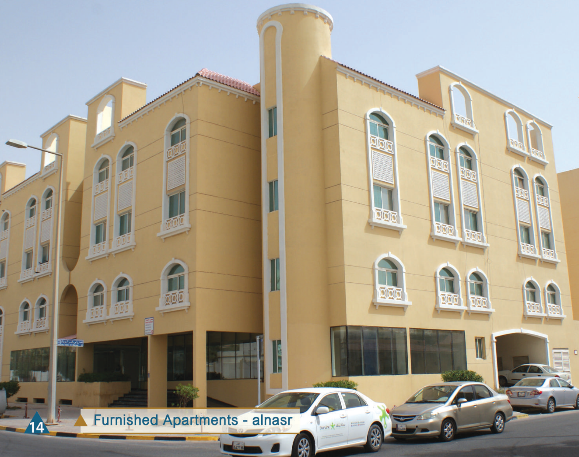
Furnished Apartments - alnaser